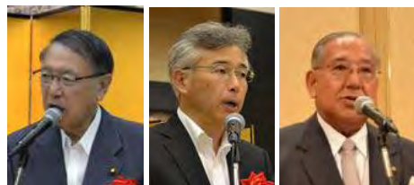
写真左から、ご来賓の丹羽衆議院議員、中井環境省廃棄物・リサイクル対策部長。写真右は主催者挨拶する石井連合会会長。