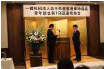
一般社団法人岩手県産業廃棄物協会 青年部会第19回通常総会